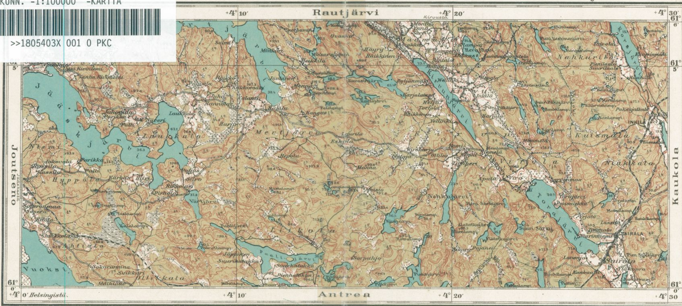
Maanmittaushallituksen topografinen osasto, 1922.