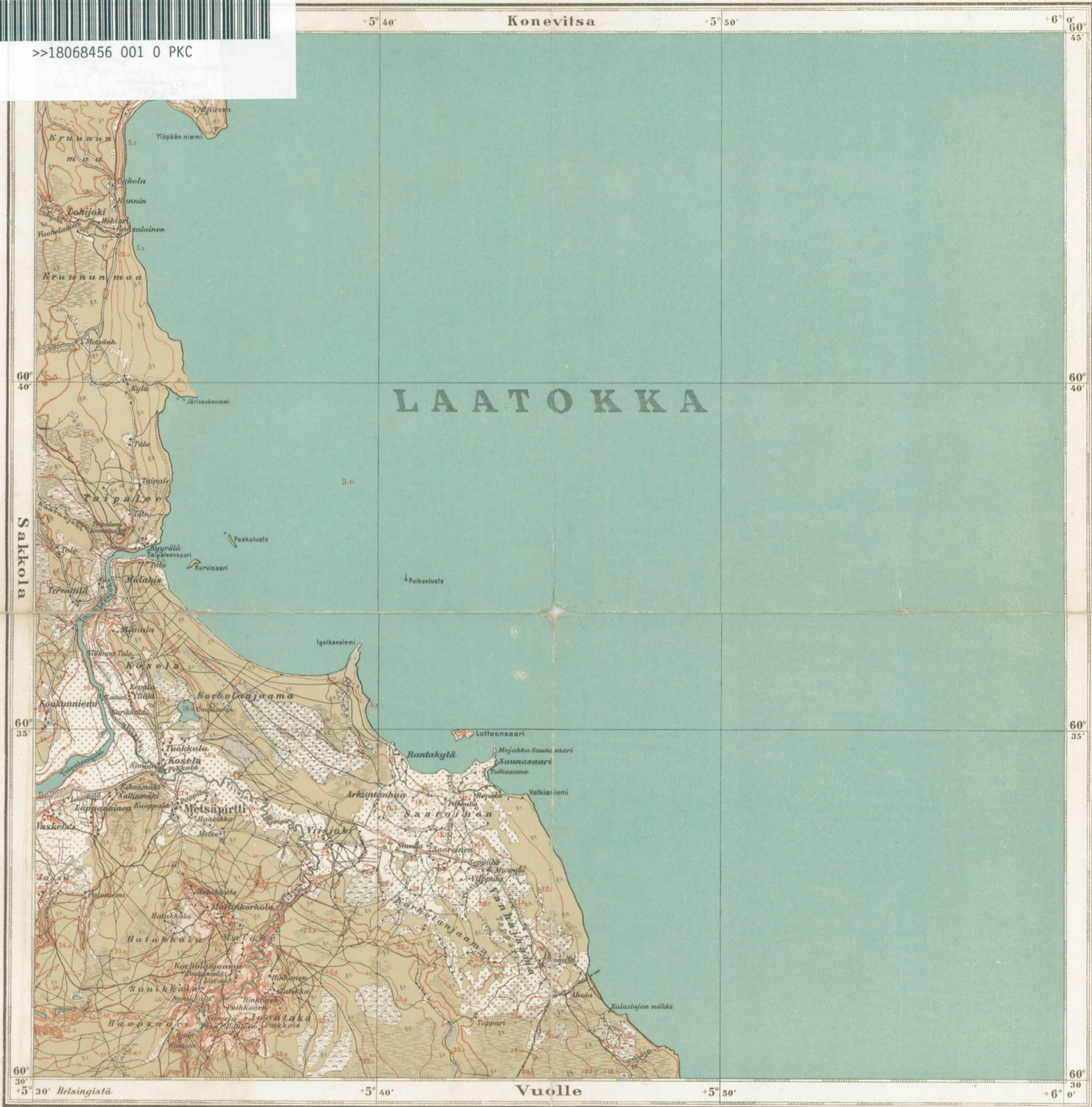
Maanmittauslaitoksen topografinen osasto, 1921.

Pyhäjärven, Sakkolan, Raudun ja Metsäpirfin kunna.